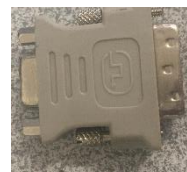
(obr. 3: redukce)