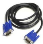
(obr. 1: VGA kabel)