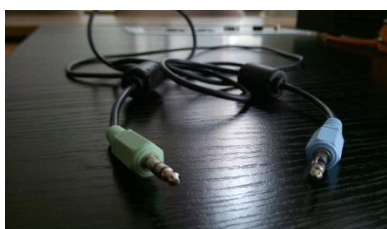
(obr. 2 - 3,5mm stereo jack)