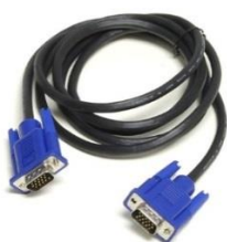
(obr. 1 – VGA kabel)