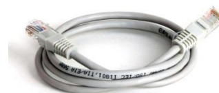
(obr. 3 - Kabel RJ45)